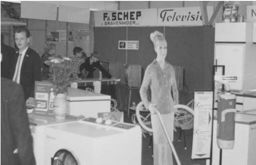
Firma Schep op de Tefado te Dongen.